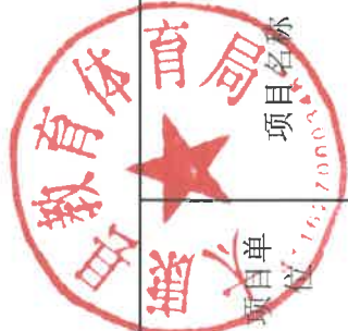
项目单位自评汇总表